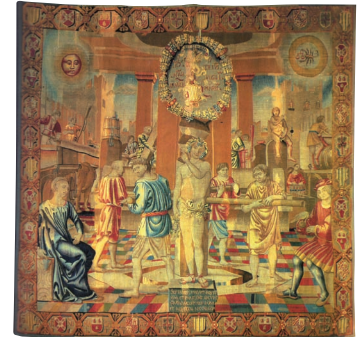
Serie de los tapices de los meses, llamados Trivulzio (1504-1509). Lana y seda, 470x500 cms. Milán, Castello Sforzesco. Portada: Septiembre - Detalles: Junio y Agosto