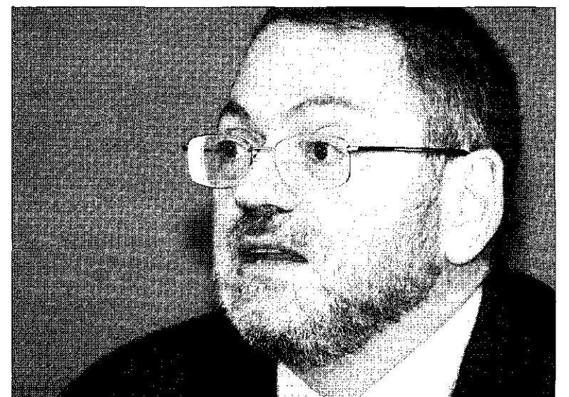
El doctor Pigrau cree que el compromiso de la administración Obama en cumplir el Protocolo de Kioto abre grandes esperanzas.

Está bien situado en algunas cosas, pero en otras no tanto. Por ejemplo, tenemos dificultades para cumplir los compromisos de Kioto en reducción de emisiones. En otros casos se hacen políticas interesantes, como la gestión de agua, y sería injusto decir que no se han mejorado los controles y las herramientas me-